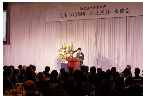
創業 100 周年記念式典・祝賀会の様子