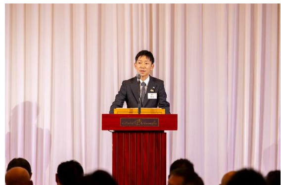
創業 100 周年記念式典・祝賀会の様子

これまでの青木商店の100年の歩みを振り返るとともに、100周年を記念して2023年10月にオープンした新事業店舗「一果房」をはじめとし、100周年を記念して名付けた青木商店オリジナルいちご「アオハルカ」や、2024年5月から開催した100周年記念キャンペーンなどの100周年事業の紹介や、2025年3月1日(土)より変更となる新社名・新ロゴ、企業メッセージについての発表を行いました。