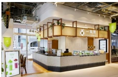
一果房 店装イメージ

「一果房」は、株式会社青木商店の100周年を記念し、2023年10月JIYUGAOKA de aone内にオープンした新業態です。その時その瞬間のフルーツと出会う「一果一会」をテーマに、フルーツの専門家が季節ごとに最もお勧めしたい“ひとつのフルーツ”にスポットを当てたフルーツジュースやスイーツを提供するお店です。フルーツの様々な品種や様々な食べ方を通して、フルーツの新たな魅力をお届けいたします。