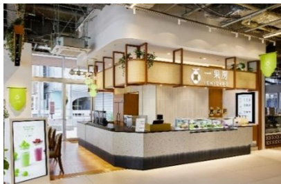
一果房 店装イメージ

「一果房」は、株式会社青木商店の100周年を記念し、2023年10月JIYUGAOKA de aone内にオープンした新業態です。その時その瞬間のフルーツと出会う「一果一会」をテーマに、フルーツの専門家が季節ごとに最もお勧めしたい“ひとつのフルーツ”にスポットを当てたフルーツジュースやスイーツを提供するお店です。フルーツの様々な品種や様々な食べ方を通して、フルーツの新たな魅力をお届けいたします。