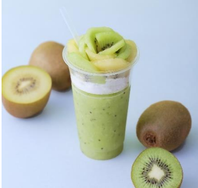
『一果のパフェ キウイ』イメージ

一果房おすすめのドリンク『旬の一果』は、店舗で熟度管理したキウイを使用した、果物専門店ならではの美味しさを味わえるこだわりのフレッシュジュースです。キウイは種が潰れるとイガイガとした食感が出てしまうため、独自のミキサーで種をつぶさず果肉が残るようにミキシングし、完熟のキウイをそのまま食べているかのような、ゴロゴロとした果肉の食感も味わえるようなドリンクに仕上げています。