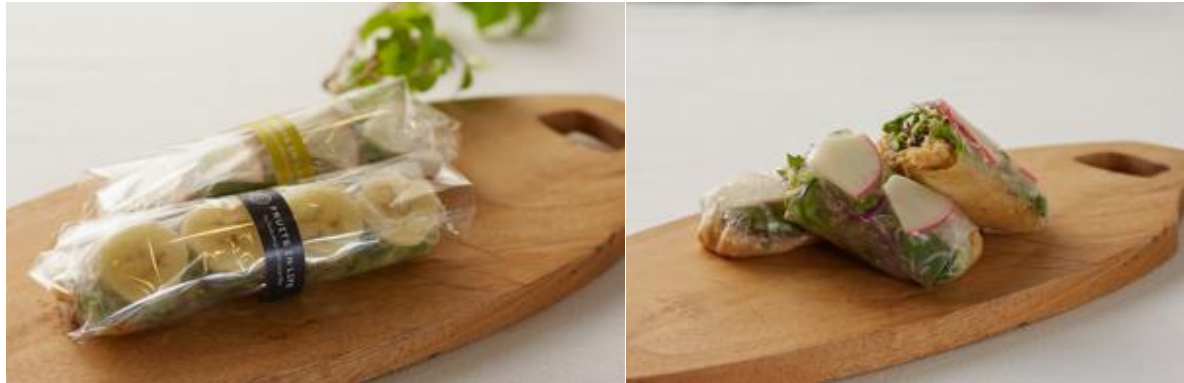
《キャロットラペ(左写真手前)、ドライラディッシュ(左写真奥、右写真) 各 350 円(税抜)》

フルーツと野菜をラップした、新感覚生春巻き。見た目も美しく、中のポテトソースに味つけがしてあるので、あとからソースをつける必要がありません。また、普通の生春巻きよりボリュームもあり腹持ちも良い。