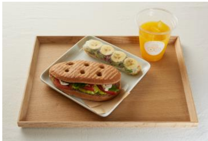
《フルフル 200 セット(一例) 1000 円(税抜)》

お好みのアボカドトーストとお好みのフルーツサラダバトン、それに本日のスロージュース(日替わり)をつけてあなたのフルーツ 1 日 200g の目標はこれで達成！ヘルシー、ビューティ、お腹もいっぱい！ぜひお試しください。セットです。