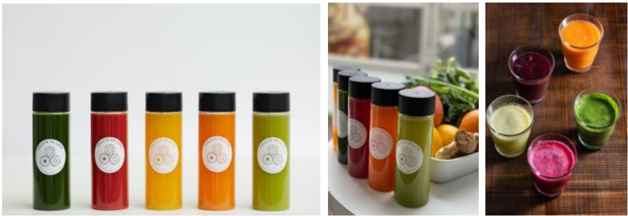
《スロージューズ 全5種類 各750円～1000円(税抜)》

朝の時間のない時、昨日飲みすぎた時、フルーツ 200g をぎゅっと押し込めたジュースで手軽にデトックス！これ1本でフルーツ 200g1 日分の摂取にとことんこだわります。 食物繊維をたくさん摂りたい時はスムージー、飲みやすさと栄養素をバランス良くならスロージューズで。