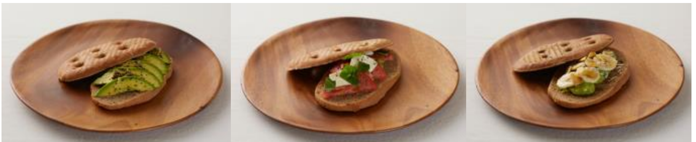
《クラシックアボカド(左)、イタリアントマト(中央)、バナナココ(右) 各 650 円(税抜)》

アボカドはフルーツだをご存知でしたか？カリウムと食物繊維、ビタミンE、葉酸、そして上質な不飽和脂肪酸がたくさん含まれたアボカドはバランスの良いエネルギーフルーツ。まさに女性にはぴったりの果物。フルーツ イン ライフではそんなアボカドに注目し、味のバリエーション豊かな3種類をアボカドトーストとして提供します。