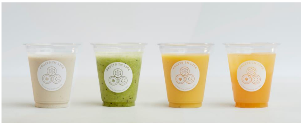
《スムージー 全9種類 各500円～600円(税抜)》

どちらも砂糖を加えず天然の甘みと素材のみの美味しさを提供します。朝の忙しい時間は特に「朝フル」活動として、フルーツを実食、もしくはジュースで摂っていただく。そんな生活習慣をフルーツ イン ライフでは促進していきます。