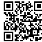
特設サイト二次元コード