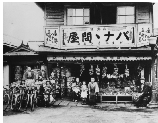
青木商店 創業当時

“フルーツ文化創造”を理念に掲げる企業としてフルーツの可能性を信じ、フルーツの持つ「健康」と「美味しさ」を多くの方にお届けすることで世の中に恩返しをしたい、フルーツを通してココロもカラダも豊かになっていただきたい、そんな想いで 100 年にわたり事業を継続してきました。