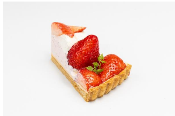
『スカイベリー』(左:1ホール、右:1ピース)

オープンを記念して、スカイベリーをふんだんに使用したタルト『スカイベリー』をエキュート秋葉原店限定で販売いたします。「大きさ、美しさ、美味しさのすべてが大空に届くようないちご」という意味が込められたスカイベリーをふんだんに使用しており、自家製いちごクリームと、スカイベリーの上品な香り、甘みが相性抜群です。果物を知り尽くした当社だからこそお届けできる、極上のフルーツタルトをお楽しみいただけます。