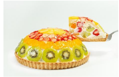
人気の商品『フルーツコット』

今回オープンするエキュート秋葉原店は、フルーツタルトや焼き菓子等を取り扱うテイクアウト専門店です。フルーツピークスの人気商品『フルーツコット』やさっぱりとしたゼリー『フルーツパニエ』など、色とりどりの旬のフルーツを使用したスイーツがシーズン商品も合わせて常時 20 種類以上ショーケースに並ぶ他、手土産やちょっとしたプレゼントにもおすすめの、フルーツの美味しさを活かした焼き菓子など、さまざまな商品ラインアップをご用意いたします。